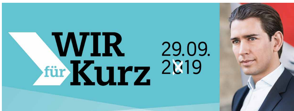
Landeshauptmann Günther Platter

Tiroler Volkspartei, 6020 Innsbruck, Fallmerayerstr. 4