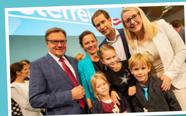
Die Volkspartei mit Sebastian Kurz steht für eine Politik der Nachhaltigkeit, die nicht nur das Hier und Jetzt im Auge hat, sondern sicherstellt, dass auch die nächste Generation alle Chancen hat.