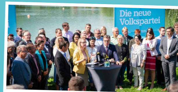
Die Tiroler Volkspartei geht mit einem Team ins Rennen, das so vielfältig ist wie unser Land. Alle Kandidatinnen und Kandidaten sind fest in ihren Gemeinden verwurzelt und bringen sich ein.