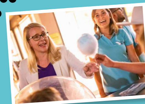
Mit Herz und Leidenschaft: Margarete Schramböck hat in diesem Wahlkampf bewiesen, dass sie nicht nur eine außerordentliche Wirtschaftsexpertin ist, sondern auch eine begeisterte Wahlkämpferin.