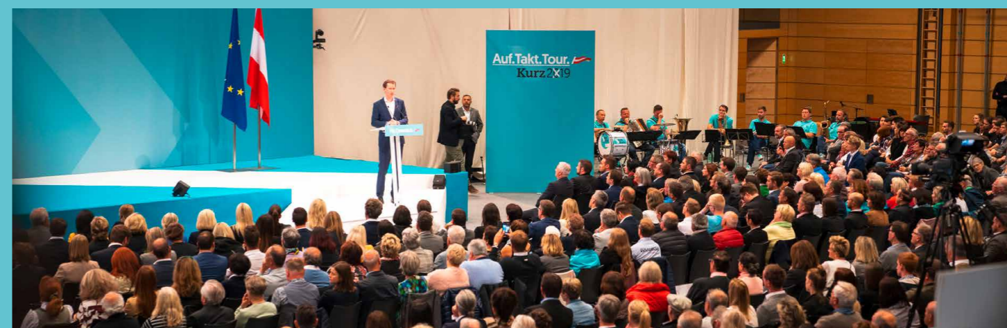
Mehr als 1.500 Menschen waren beim Start des Intensivwahlkampfs in der Kufstein Arena mit dabei. Sebastian Kurz gab in seiner Rede die Richtung vor: „Beteiligen wir uns nicht am gegenseitigen Schlechtreden und Anpatzen, sondern zeigen wir den Menschen, dass Politik auch anders geht. Mit klaren Konzepten, mutigen Ideen und festen Werten.“